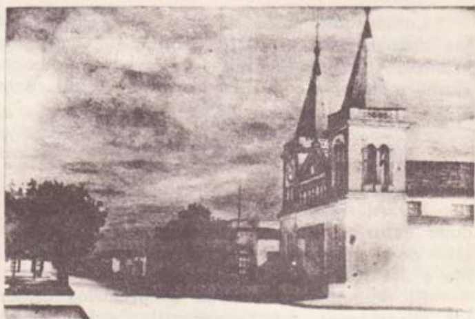
SdÍ. del YÍ: Iglesia Parroquial (Pintura de L. Gastaldi)