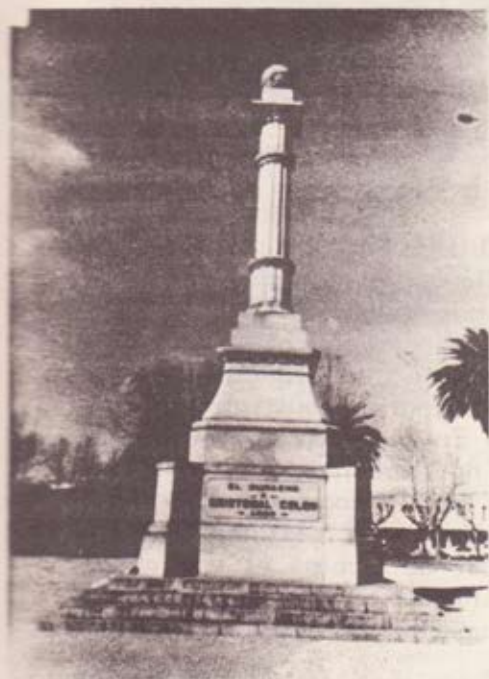
Monumento a Cristóbal Colón