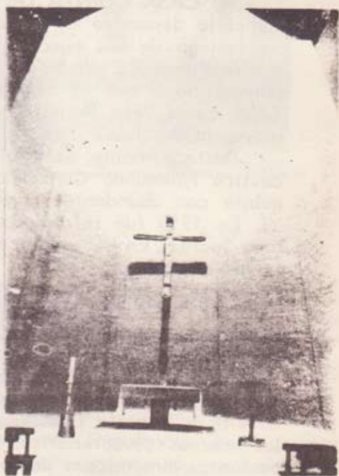
Iglesia San Pedro