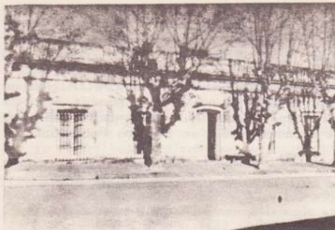
Casa natal de Miguel Rubino