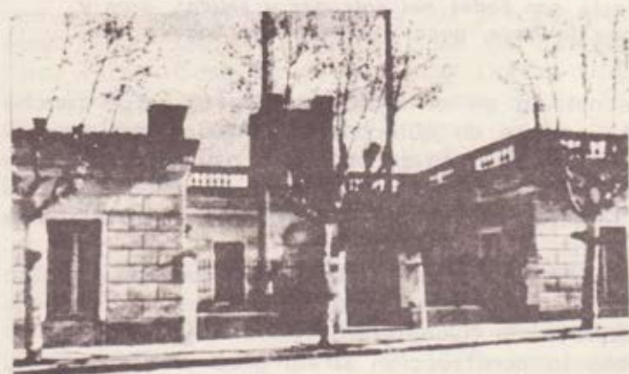
Residencia de Emilio Penza ("el tío")