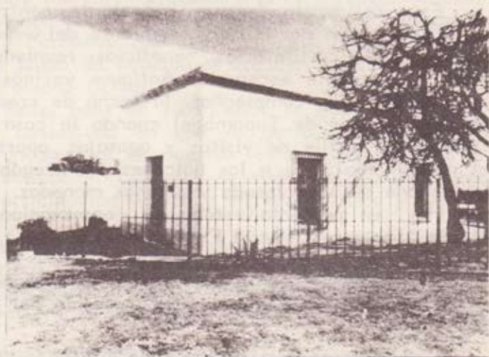
Azotea de "La Guayreña"