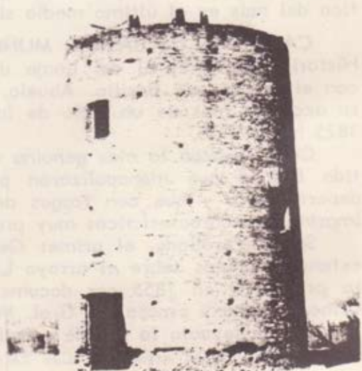
San Jorge: Antigo molino construido por los ingleses