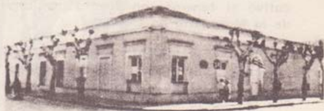
Una de las construcciones más antiguas de San Pedro del Durazno.