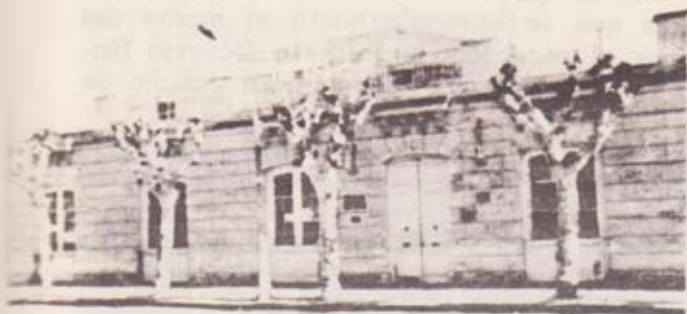
Casa del Gral. Fructuoso Rivera