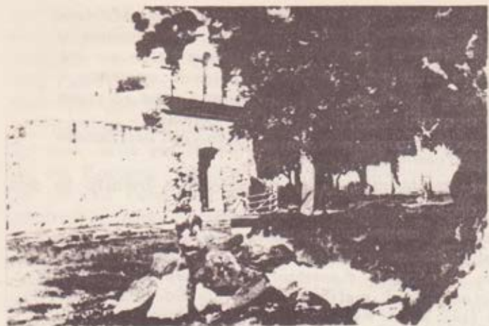
Capilla del "Farruco"